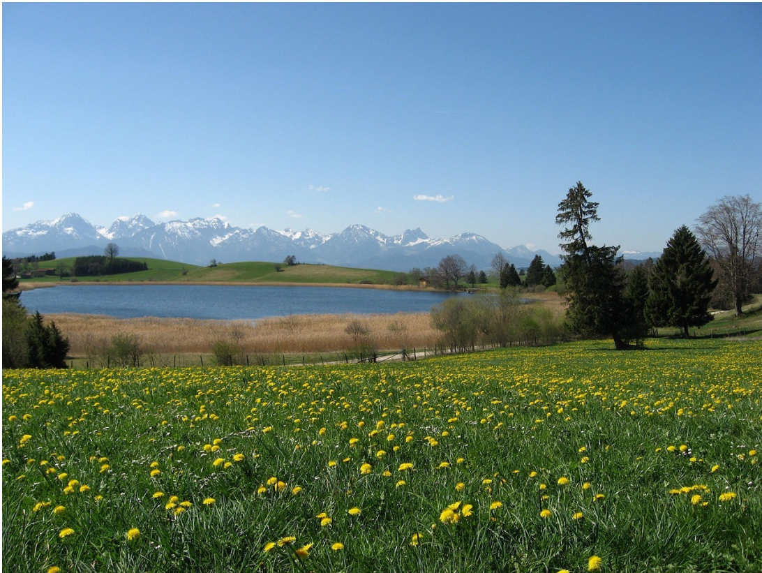
Gelber Löwenzahn auf saftig grünen Wiesen, schneebedeckte Berggipfel, tiefblauer Himmel und ein einladender See - ein typischer Anblick im Frühling im Allgäu