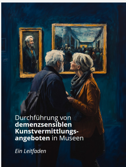
Durchführung von demenzsensiblen Kunstvermittlungsangeboten in Museen

„Erinnerungs_reich – Museen als Medizin für Menschen mit Demenz“: Die Besuche bieten hohen Nutzen bei geringen Kosten. Gemeinsam mit Kunstvermittlern aus sächsischen Museen entwickelte die TU Dresden in dem Projekt einen Leitfaden für Museumsbesuche von Menschen mit Demenz. Die kostenlose Handreichung unterstützt Einrichtungen dabei, Teilhabe an Kultur zu fördern. Hier finden Sie weitere Informationen und den Leitfaden .